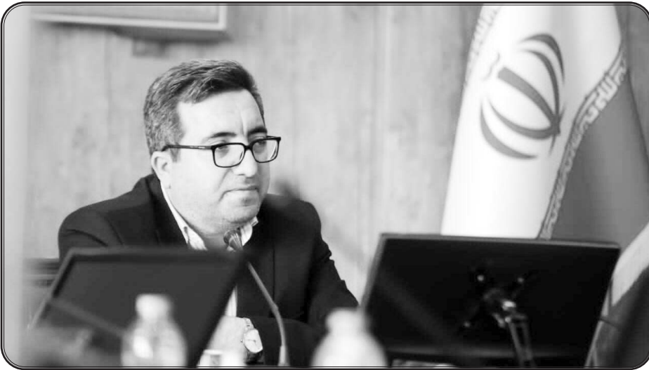
امید به کاهش ۷۰ درصدی پرونده‌های قضایی

دادگستری و مرکز مشاوران قوه قضاییه) استفاده خواهد شد. با تدوین آیین‌نامه‌ها و دستورالعمل‌های لازم، حدود ۵۰ هزار کارگزار در سراسر کشور در فرآیند احراز و تثبیت مالکیت به واحدهای ثبتی کمک خواهند کرد تا از تراکم کاری در ادارات ثبت جلوگیری شود.