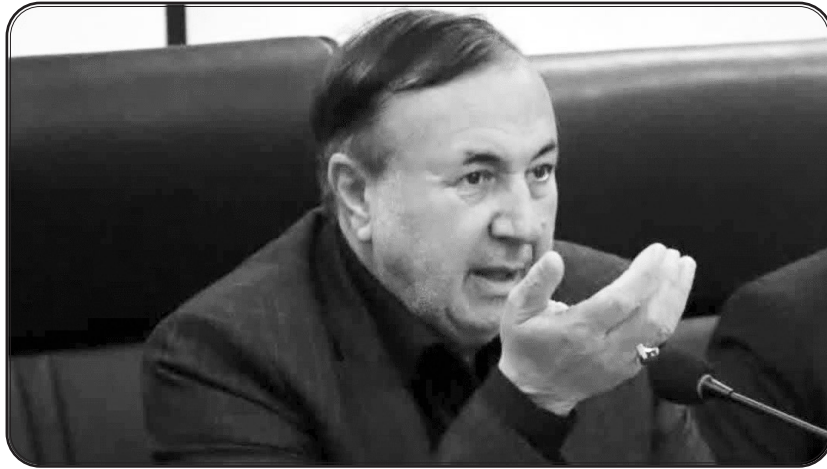
تداوم انحصارگرایی در برخی بخش‌های وزارت جهاد کشاورزی

وی با اشاره به تداوم انحصارگرایی در برخی بخش‌های وزارت جهاد کشاورزی، تأکید کرد: حذف ارز ترجیحی تا حدودی مانع رانت و ویژه‌خواری شد اما همچنان مافیای مشغول فعالیت هستند و اقتصاد ایران را بیمار نگه داشته‌اند.