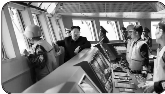
به نوشته خبرگزاری «اسیونیک»، وی در این‌باره توضیح داد: «نیروی دریایی در حال تبدیل شدن به یک

شاخه کامل از نیروهای مسلح است که به دارایی‌های راهبردی مجهز شده است، به این معنی که برنامه تجهیز آن به سلاح‌های هسته‌ای دقیقاً طبق برنامه پیش می‌رود.»