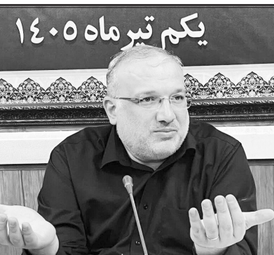
یکم تیر ماه ۱۴۰۵