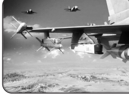
ایکون خود به قدرتی تطبیق‌دهنده در میدان تبدیل شده است.

این جمله افسر ارشد اسرائیلی، بهترین تأیید بر این واقعیت است که تهران نه تنها تسلیم جنگ الکترونیک نشده، بلکه