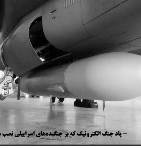
پاد جنگ الکترونیک که بر جنگنده‌های اسرائیلی نصب می‌شود

به گزارش منابع میدانی، تقریباً تمام حملات اسرائیل به مواضع درون خاک ایران با استفاده از موشک‌های دورایستا مانند «رامپج» (Rampage) و «راکز» (Rocks) انجام شده است. این موشک‌ها که از فاصله ۱۵۰ تا ۲۰۰ کیلومتری شلیک می‌شوند، عملاً جنگنده پرتابگر را از محدوده پدافند فرسوخ ایران خارج می‌کنند.