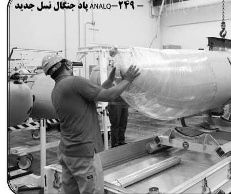
۲۴۹-ANALQ پاد جنگال نسل جدید

پنتاگون و تل‌آویو اکنون خود را در یک تنگنا می‌بینند: اگر با جنگنده نفوذ کنند، در خطر سامانه‌های حرارتی ایران هستند؛ اگر از موشک‌های دورایستا استفاده کنند، قدرت تخریب و دقت نقطه‌زنی آن‌ها به مراتب کمتر از بمب‌های هدایت‌شونده هوایی است. شاید وقت آن رسیده که غرب مفهوم «تسلط هوایی» را بازتعریف کند. در آسمان ایران، دیگر هیچ هوابیمایی - حتی اف-۳۵ - احساس امنیت نمی‌کند.