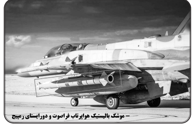
موشک بالستیک هواپرتاب فراصوت دورایستای زمین

به گزارش منابع وابسته به پنتاگون، در ماه اول درگیری (از ۲۸ فوریه ۲۰۲۶)