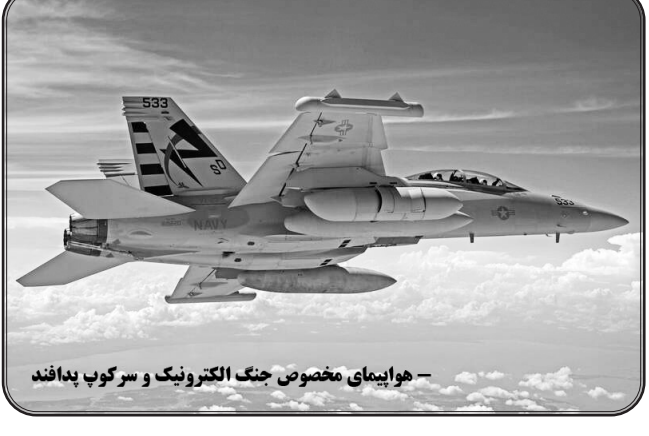
هوابیما مخصوص جنگ الکترونیک و سرگوب پدافند

به گفته‌ی این افسر ارشد حوزه جنگال رژیم، در سال‌های گذشته جنگ در چهار عرصه تعریف می‌شد: هوا، دریا، زمین و اخیراً سایبر.