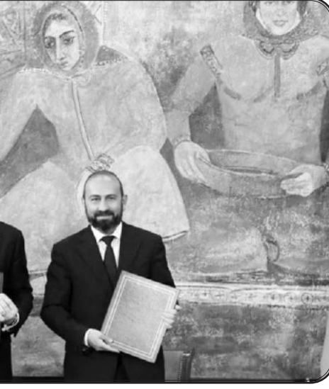
برای آمریکا: نقطه روشنی در میان تحولات ناخوشایند در منطقه

در نهایت، با وجود برخی زمه‌ها در اوایل دولت پاشینیان درباره احتمال حرکت به سمت دوری از اتحادیه اقتصادی اوراسیا تحت سلطه روسیه (که ارمنستان عضو آن است)، دولت ارمنستان به طور عمومی به تعهد خود نسبت به این سازمان تأکید مجدد کرده و برای رفع نگرانی‌های روسیه در مورد هرگونه تغییر سیاست احتمالی در این زمینه تلاش کرده است. همه این عوامل نشان می‌دهد که انتظار جدایی واقعی از روسیه در آینده نزدیک از ارمنستان واقع‌بینانه نیست.»