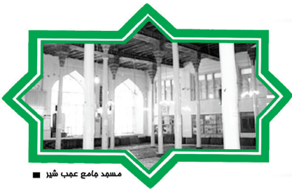
مسجد جامع عجب شهر