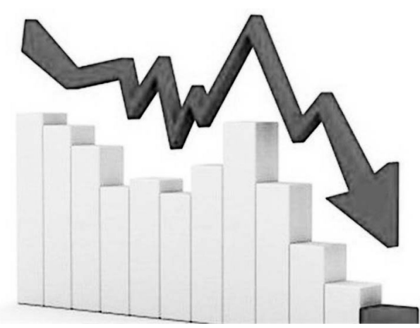
می‌باشد که در مقایسه با همین اطلاع در ماه قبل (۱.۳ درصد)، ۰.۴ واحد درصد است.

در این ماه بیشترین تورم ماهانه با ۴.۷ درصد مربوط به گروه «ساخت تجهیزات برقی» و کمترین تورم ماهانه با ۰.۱ درصد مربوط به گروه «ساخت کاغذ و محصولات کاغذی» می‌باشد. همچنین در این ماه گروه «ساخت فراورده‌های توتون و تنباکو» با تورم منفی ۴ درصد مواجه بوده است.