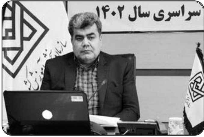
شرکت در کنکور شده‌اند، انتظار دارند که در یک رقابت سالم و ایمن شرکت کنند و آزمون است.

رییس شورای حفاظت آزمون سراسری خاطرنشان کرد: از طرف دیگر کسانی که در این گروه‌ها اقدام به ارسال مدارک و هرگونه پرداخت وجه می‌کنند با معرفی به مراجع قضایی حسب مورد مطابق با اعمال مجرمانه صورت پذیرفته حتی مشمول مجازات حبس هم می‌شوند. قائم مقام رییس سازمان سنجش آموزش کشور تأکید کرد: حفاظت از امنیت آزمون سراسری مطالبه ملی و از مصادیق حقوق عامه است و با توجه به وظایف ذاتی و مصوبه شورای امنیت کشور دستگاه‌های آزمون سراسری مسؤولیت دارند لذا با تمهیدات اندیشیده شده هیچ داوطلب تقلبی وارد دانشگاه نخواهد شد.