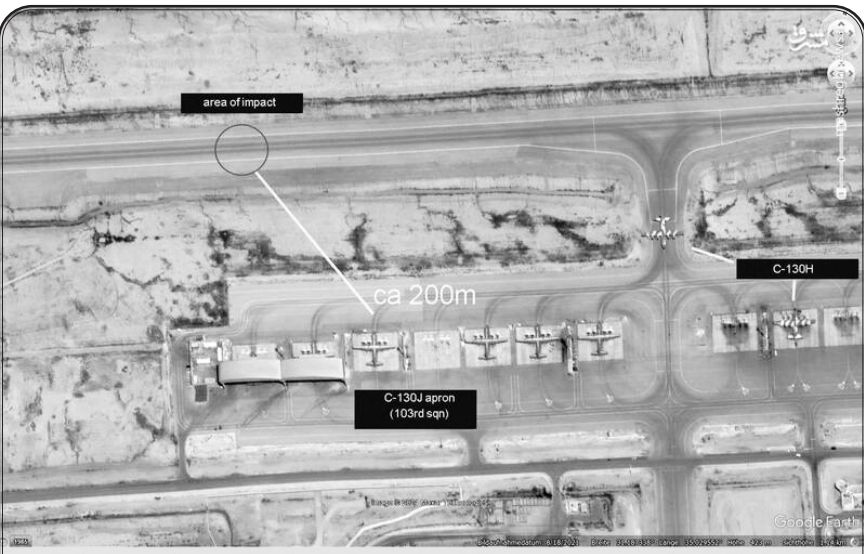
تصویر ماهواره ای از محل استقرار هواپیماهای ترابری هرکولس اسرائیل و اصابت موشک ایرانی در نزدیکی این محل روی باند اصلی نشست و برخواست

موشک خیبرشکن با توانایی گلاید و مانور فرار از سامانه های پدافندی در شیرجه نهایی و همچنین موشک های میانبرد قدر و عماد با کلاهک هدایت شونده و سرعتی بسیار بیشتر از موشک‌های خانواده فاتح (جیزی) نزدیک به ۱۰ ماخ مدرنترین سامانه های پدافندی صهیونیست‌ها را ناکام گذاشتند.