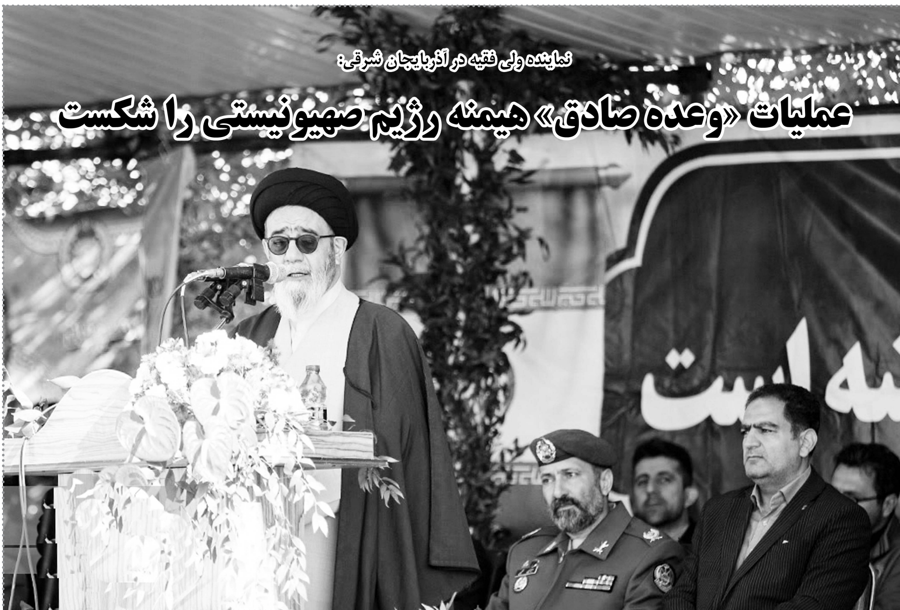
نماینده ولی فقیه در آذربایجان شرقی: