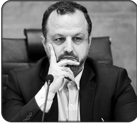
وی با اشاره به ریشه های نا ترازی های اقتصاد کشور در دهه ۱۳۹۰ تصریح کرد: این امر ناشی از نا ترازی هایی بود که در

شبکه بانکی کشور ایجاد شده بود و البته تا امروز هم به نحوی، همچنان درگیر پیامدهای آن هستیم.