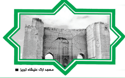
مسجد ارک عیاشه گیلان