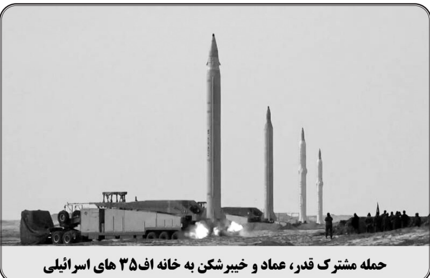
حمله مشترک قدر، عماد و خیبرشکن به خانه اف ۳۵ های اسرائیلی

همچنین این عملیات نخستین استفاده رزمی از موشک‌های بالستیک میانبرد ایرانی نیز محسوب می‌شود؛ در عملیات های موشکی گذشته عمدتاً از موشک‌های بالستیک کوتاه برد خانواده فاتح نظیر فاتح ۱۱۰، فاتح ۳۱۳، ذوالفقار و خیبرشکن یا موشک قیام استفاده