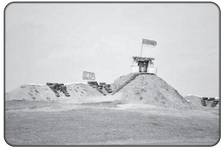
این مقام ارمنی در ادامه افزود: با وجود ابراز تاسف ارمنستان و جامعه جهانی، حتی این دادگاه هم نتوانست جلوی پاکسازی نژادی را از سوی باکو بگیرد و جمهوری آذربایجان در سپتامبر ۲۰۲۳ (شهریور ۱۴۰۲) پس از ۹ ماه گرسنگی دادن به ارمنیان ساکن قره‌باغ از طریق انسداد گذرگاه لاجین، یک حمله غیرقانونی را آغاز کرد، صدها نفر را کشت و بیش از ۱۰۰ هزار نفر دیگر از ارمنی‌های ساکن