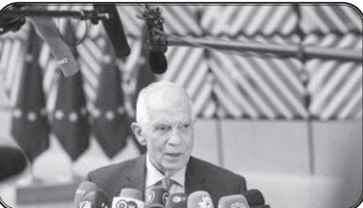
وی تأکید کرد: اتحادیه اروپا قدرت دیپلماتیک دارد و هدفش کاهش تنش در منطقه از طریق روابط خود با تل‌آویو و کشورهای عضو، به ویژه آلمان، و متحدان بین‌المللی آن مانند واشنگتن است.

رئیس سیاست خارجی اتحادیه اروپا در سخنانی گفت که این اتحادیه در شرایط فعلی نمی‌تواند سپاه پاسداران جمهوری اسلامی ایران را «تروریستی» اعلام کند. «جو زپ بول» در گفت‌وگو با روزنامه لوموند در این باره گفت: «ما بارها درباره افزودن سپاه پاسداران به فهرست سازمان‌های تروریستی صحبت کرده‌ایم و این کاری بود که دونالد ترامپ، رئیس‌جمهور سابق آمریکا انجام داد، با این وجود مقام قضایی اتحادیه اروپا باید تشخیص دهد که سپاه مرتکب اقدام تروریستی شده است و در حال حاضر چنین نیست.» وی درباره تحریم‌های جدید علیه تهران نیز گفت: این اقدام ابتدا مستلزم وجود چیزهایی است که قابل تحریم باشد. بول همچنین تأکید کرد: در پی پاسخ احتمالی اسرائیل به حمله‌ای که ایران با پهباد و موشک انجام داده است، به نفع همه است که شاهد رویارویی منطقه‌ای نباشیم.