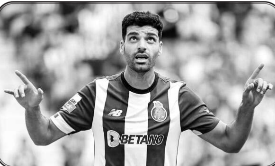
کلیدی ازدها به یک بازیکن خارج از ترکیب تبدیل شود. هرچند طارمی با مخالفت مدیریت باشگاه پورتو و فشار هواداران سفر خود را در زمستان به ایتالیا لغو کرد ولی انتقال ستاره ایرانی در تابستان