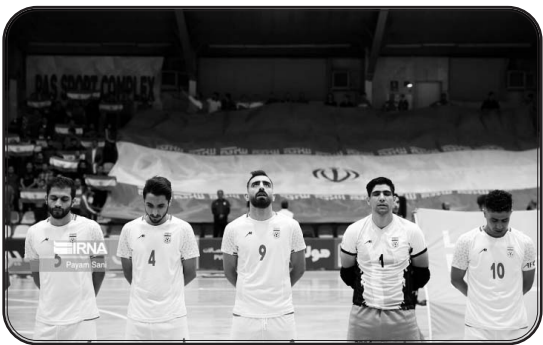
رکوردداران قهرمانی در فوتسال جام ملت‌های آسیا ایران (۱۲) ژاپن (۴)

ایران قدرت نخست این رقابت‌هاست که در گروه D قرار دارد و صدرنشینی در این گروه را نشانه گرفته است. همچنین افغانستان که اولین حضورش در جام ملت‌های فوتسال آسیا را تجربه خواهد کرد، در این گروه قرار دارد.