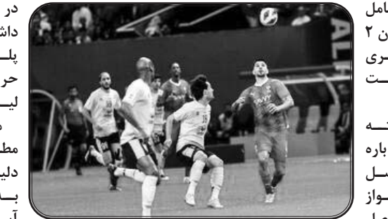
او ادامه داد: تیم سوم جدول هم به لیگ قهرمانان ۲ می‌رود و در